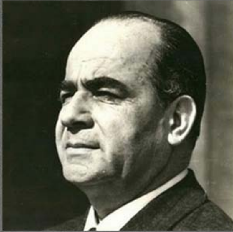
Faruk Nafiz Çamlıbel Hayatı